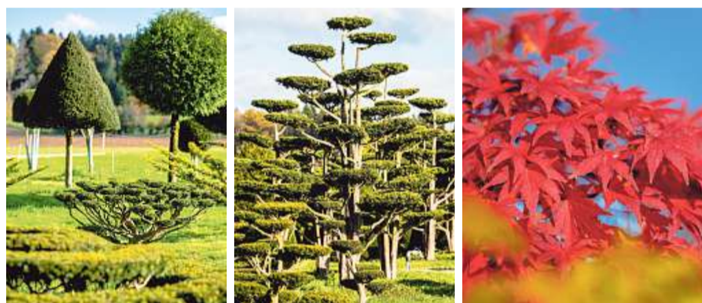
Herbstliche Impressionen von den verschiedenen Quartieren der Baumschule

Anderegg Baumschulen AG Lotzwilfeldweg 24A, 4900 Langenthal T: 062 922 13 14 E-Mail: top@anderegg-baumschulen.ch www.anderegg-baumschulen.ch