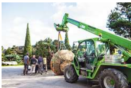
Der sichere Transport eines Baumes erfordert Teamwork.