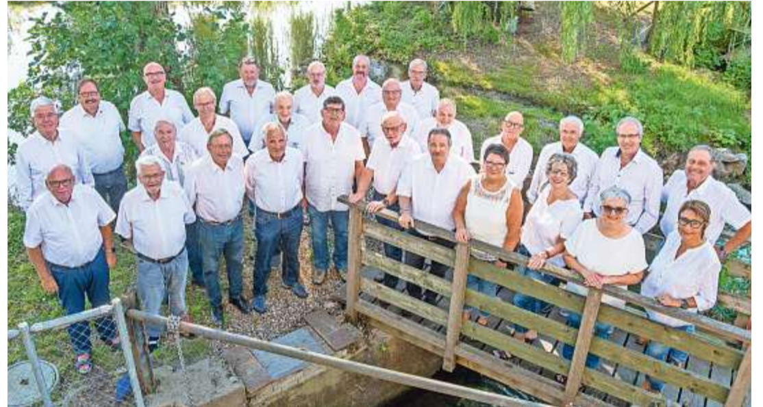
Sie planen und organisieren einen sportlichen Grossanlass im Oberaargau: Das 27 Personen umfassende Organisationskomitee des Eidgenössischen Schützenfestes für Veteranen 2024 in Langenthal und Melchnau.