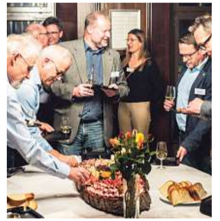
Nach dem offiziellen Teil gab es beim Apéro die Gelegenheit, sich auszutauschen.