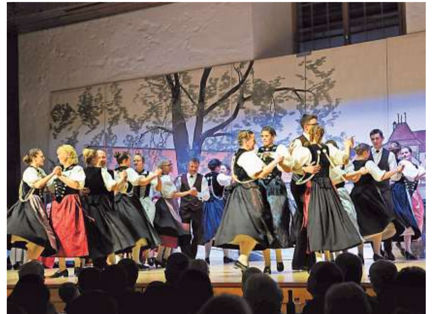
Trachtentänze sind geprägt von schmucken Trachten und immer neuen Choreografien.

Trachtenfamilie und Gäste waren begeistert vom ganzen Programm. (eing)