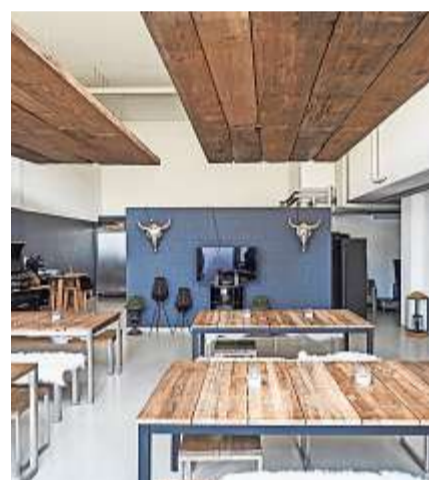
In der Grill-Kitchen können Kurse besucht oder Events für bis zu 35 Personen organisiert werden.