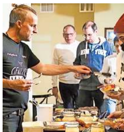
Impression von der 1. Partygriller Genussnacht in der Pflugfabrik in Ersigen anlässlich des 10-jährigen Bestehens.

«Partygriller grillt immer und überall, ob im Sommer oder im verschneiten Winter, hoch über den Dächern auf Deiner Terrasse, einfach im Garten, in Waldhäusern, im Nostalgie-Zug von Aareseeland Mobil oder einfach immer dort, wo Du möchtest.»