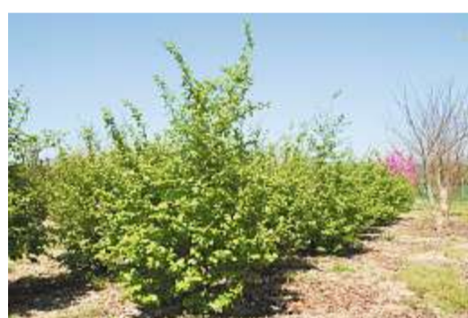
Parrotia: In handlicher Grösse als Strauch.

Anderegg Baumschulen AG Lotzwilfeldweg 24A, 4900 Langenthal anderegg-baumschulen.ch