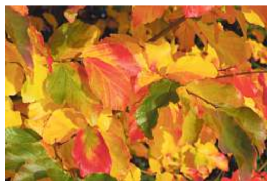
Parrotia: Kunterbuntes Herbstlaub.