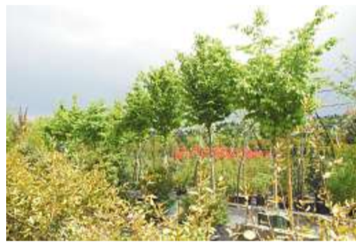
Parrotia: Als Alleebaum.