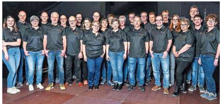
Die 26 Köpfe hinter dem Festival, welche sich mit Leidenschaft für Musik engagieren.

Über die Jahre ist es gelungen ein solides Netzwerk mit Künstler*innen und deren Agenturen aufzubauen. Dabei sind verschiedene Stilrichtungen vertreten, damit nach Möglichkeit für jeden etwas dabei ist. Der Bereich Sponsoring benötigt grossen Effort, denn ohne Partner*innen wäre es nicht möglich, so einen Anlass auf die Beine zu stellen. Dabei gibt es ver-