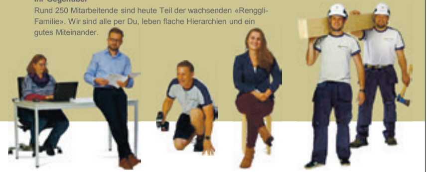
Renggli AG | Gläng 16 | 6247 Schötz