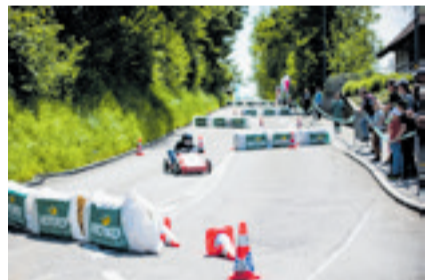
«Seifenkisten GP Oberaargau»

Nebst den Schweizer Meisterschaften und den lizenzierten Fahrerinnen und Fahrern starten an beiden Tagen Familien aus der Region sowie Unternehmen und Freizeiteams auf der rund 500 Meter langen Strecke des «Schlosshoger». Ebenso unterwegs werden dann ebenfalls Personen mit einer