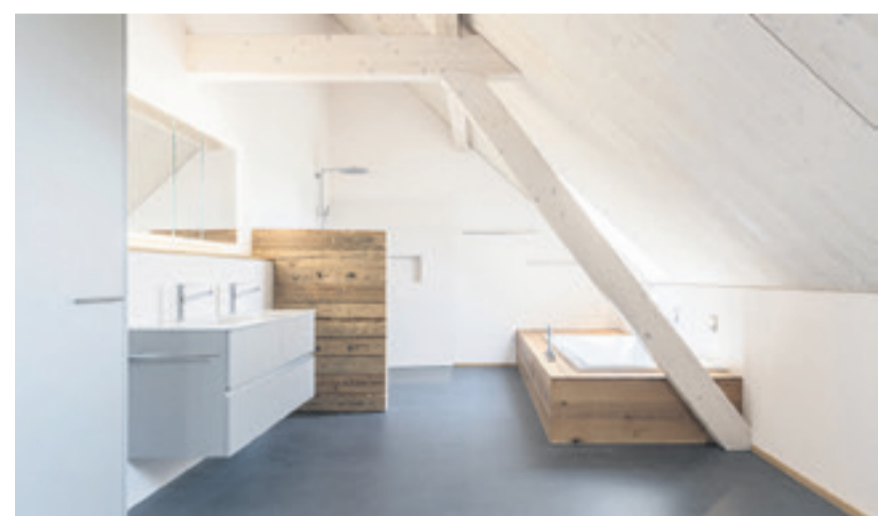
Auch für Anliegen rund um den Neubau oder die Sanierung eines Bades ist die Fischer-Käser AG der richtige Ansprechpartner