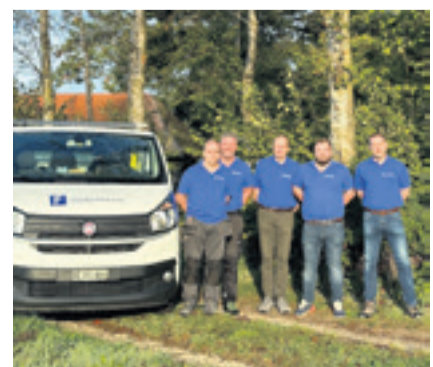
Die Geschäfts- und Abteilungsleitung der Fischer-Käser AG im Bereich Sanitär und Heizung

AQUACLEAN von Geberit, Enthärtungsanlagen chemisch und physikalisch, Erdgasinstallationen und Spezialgase, Druckluftnetze für Gewerbe und Industrie, Grauwassernutzung, Raumabluft in Nasszellen und Küchen, Regenwassernutzung, Rohrleitungsbau in PE, Waschmaschinen und Wäschetrockner, Filter- und Wasserbehandlungsanlagen, Wellnessprodukte wie Dampfduschen und Sprudelbäder, Zentralstaubsauganlagen