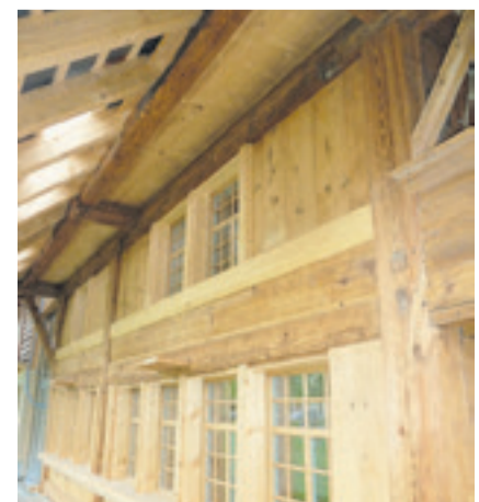
Fassade eines Hauses aus Altholz