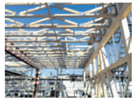
Eine Konstruktion bestehend aus Nagelplattenbinderelementen

werden einerseits die Produktionsgebäude und andererseits benachbarte Liegenschaften geheizt.