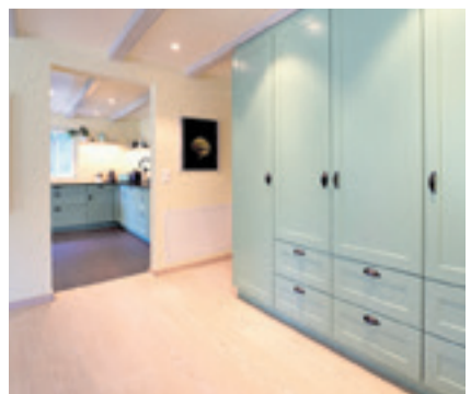
Innenausbau nach Kundenwunsch (Schränke und Küche)