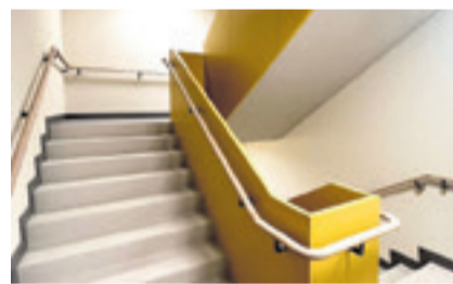
Einige der zusammenhängenden Handläufe aus Eiche, welche im neuen Alterszentrum Haslibrunnen installiert wurden

Dachtragwerke aus Nagelplattenbindern sind Holzbaukonstruktionen, die in tragender Funktion eingesetzt werden und sich durch besondere Effizienz auszeichnen. Dank der einzigartigen Verbindung von Holz und Metall ist es möglich, eine Spannweite von bis zu 35 Metern stützenfrei zu überbrücken. Diese Bauweise ist somit ideal für grosse Hallen, mehrgeschossige Bauten oder besondere Dachformen. Man arbeitet in Madiswil nicht nur mit einem nachwachsenden Rohstoff, der CO 2 bindet, zu 100% genutzt werden kann und wo immer möglich aus der Region stammt, sondern produziert dank eigenem Solarstrom grösstenteils ressourcenschonend und ökologisch. Mit den anfallenden Holzabfällen