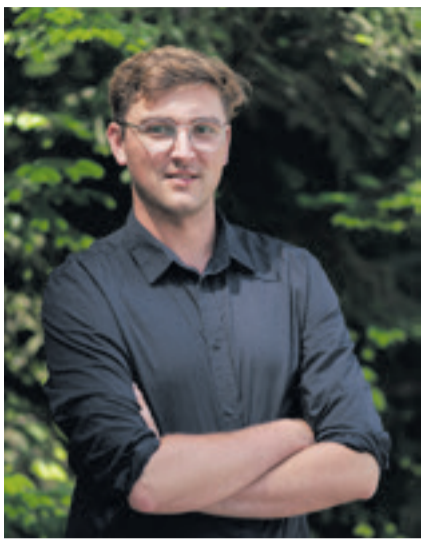
Regisseur Simon Burkhalter

Die Inszenierung in deutscher Sprache findet als erster Anlass in der denkmalgeschützten Ofenhalle im Porzi-Areal statt. Der Jungregisseur Simon Burkhalter integriert den geschichtsträchtigen Spielort geschickt in seine Inszenierung: Er verlegt den Schauplatz aus dem Böhmisches Wald der 1850er-Jahre in die industrielle Welt des Langenthaler Porzellans