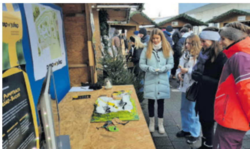
Am Buchsi-Sonntag von Anfang Dezember liessen sich viele Besucherinnen und Besucher über das Pumptrack-Projekt informieren.