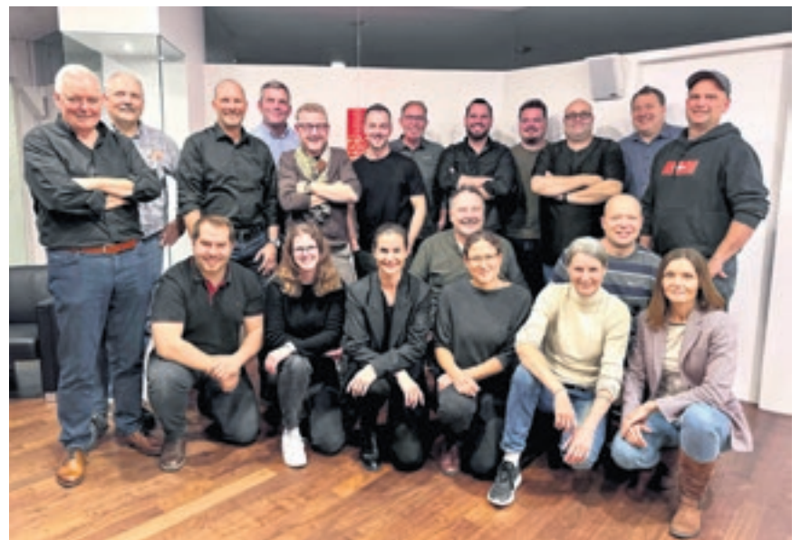
Zusammensetzung Organisationskomitee OSF 2027:

Ebenfalls zu gegebener Zeit werden Infos zum Ticket-Vorverkauf kommuniziert. Auf der Website www.osf-2027.ch sind ab Frühling 2025 Informationen zum Oberaargauischen Schwingfest Langenthal zu finden. Bereits aktiv sind die Social-Media-Profile des Fests: Interessierte finden das OSF 2027 auf Instagram, Facebook und LinkedIn – sie benutzen für Posts, Reels, Storys etc. den Hashtag #osf2027. ■