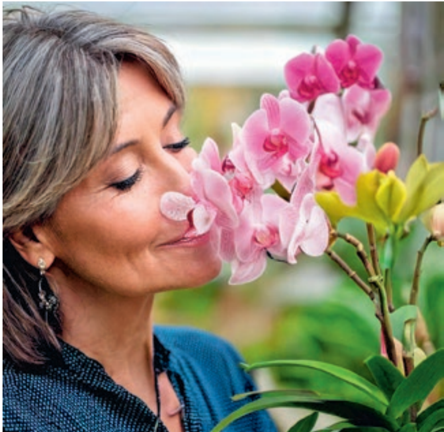
Das Sortiment umfasst viele duftende Orchideen.

www.wyssgarten.ch www.instagram.com/wyssgarten www.facebook.com/wyssgarten