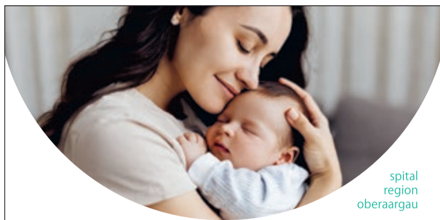
spital region oberaargau