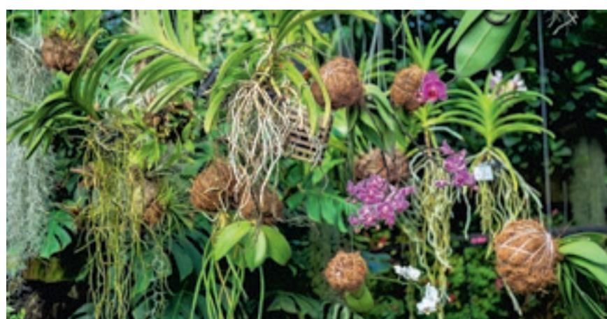
Eine weitere Besonderheit am Orchideenmarkt sind Kokodama, Schalen aus echten Kokosfasern, welche hängend oder stehend verwendet werden können.