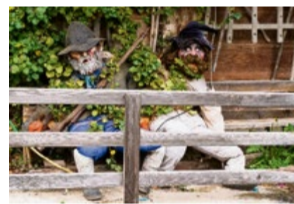
2 Puppen beim Bauernhof Bleiche in Rohrbach