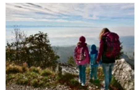
Bättlerküche, Farnern

gleichzeitig auf die vielfältigen Angebote und Erlebnisse der Region aufmerksam zu machen.