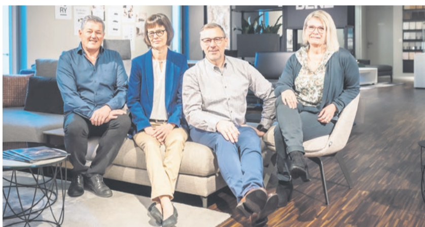
Ihr Schweizer Familien-Unternehmen - auf 2000 m 2 alles zum schöner Wohnen

Guter Geschmack ist kein Luxus und muss nicht teuer sein. Möbel Kamber hat sich über 73 Jahre immer wieder neu ausgerichtet und die verschiedenen Möbel-Sortimente den Kundenwünschen angepasst. Dank der 40-jährigen Mitgliedschaft bei der Garant-Möbel-Gruppe und dem gemeinsamen Entwickeln und Einkauf von neuen Produkten bietet Möbel Kamber ein überdurchschnittliches Preis-Leistungs-Verhältnis und garantiert so einen nachhaltigen Umgang mit Ressourcen. Die Kundschaft kann die Grösse, Material und Funktion bei Polstergarnituren, Wohnkombinationen und Tischgarnituren selber auswählen und erhält so eine massgeschneiderte Einrichtung, getreu dem Motto „geht nicht, gib'ts nicht.“