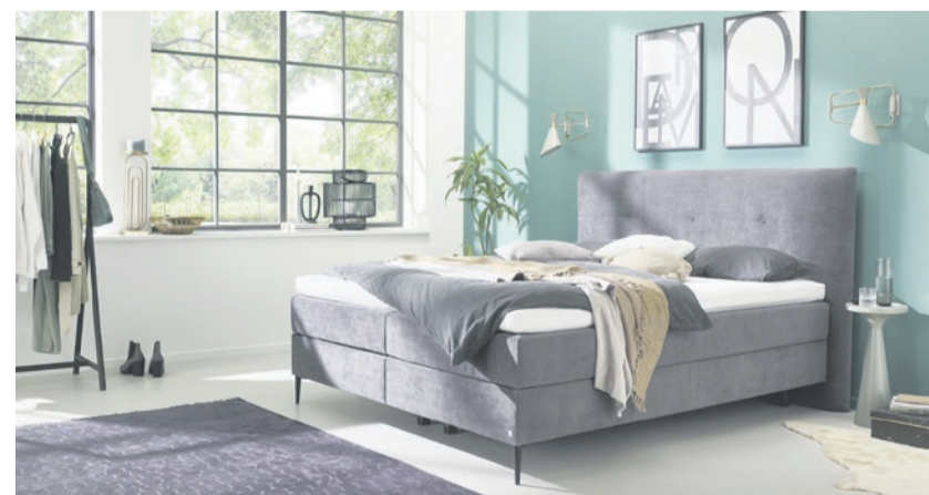
Boxspringbett in Stoff, 180 x 200 cm inkl. Topper statt Fr. 3274.- Hit Fr. 2620.-