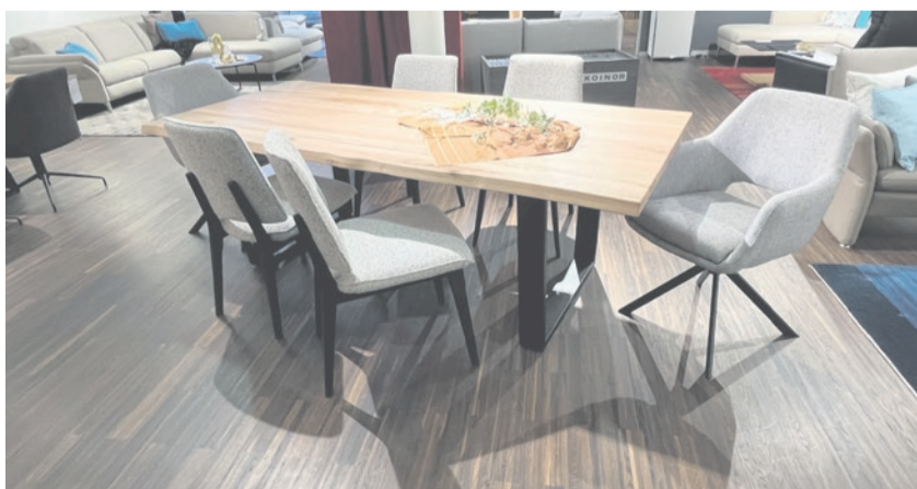
Esstisch in Wildeiche massiv, 200 x 100 cm statt 2428.- Preis-Hit Fr. 1945.-

73 Jahre Mehrwert Als ausgewiesener Rumdumeinrichter bietet die Inhaber geführte Möbel Kamber nebst der Planung Ihrer Einrichtung auch den richtigen Rahmen, um Ihre Lieblingsstücke voll zur Geltung zu bringen. Ob ein robuster Vinyl-, edler Parkettboden oder ein kuschliger Teppich verlangt werden. Auch bei Ihnen zu Hause werden Sie fachgerecht beraten. Die Verlegung ist im Preis inbegriffen. Die grosse Auswahl an Vorhangstoffen lässt keine Wünsche