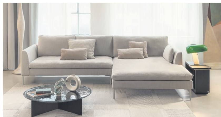
Sofa Mioko von Rolf Benz, 279 x 191 cm Preis-Hit Fr. 6760.-